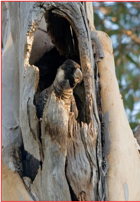
Hembra Cacatúa de Baudin en su nido

manzanas y las peras de fructificación. También néctar, brotes y flores y tiras de corteza de árboles muertos en busca de larvas de escarabajo. Buscan alimento en todos los niveles desde la copa del árbol hasta el suelo.