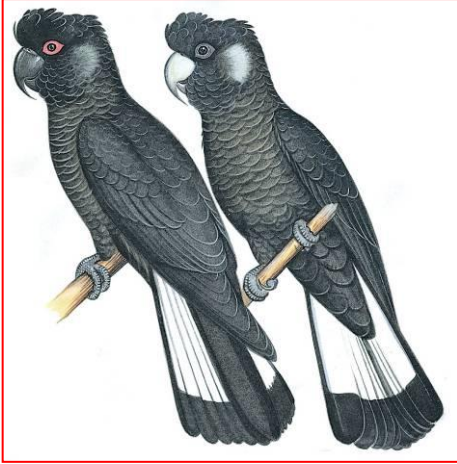
Macho (a la izquierda) Hembra (a la derecha)